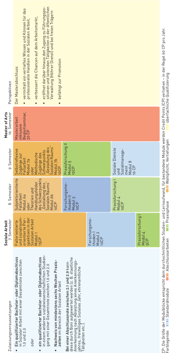
CP: Die Größe der Modulblöcke entspricht dem durchschnittlichen Studien- und Lernaufwand, für bestandene Module werden Credit Points (CP) verliehen – in der Regel 60 CP pro Jahr. Farblgende: ■■■ Standardmodule ■ Abschlussarbeiten ■■ Praxisphase ■ Wahlpflicht, Vertiefungen ■ überfachliche Qualifizierung

Qualifikationen und Kompetenzen für diese Tätigkeitsfelder vermitteln die Module des Masterstudiengangs Soziale Arbeit. Die Studieneinheiten umfassen Vorlesungen und Seminare, Planungswerkstätten und ein Lehrforschungsprojekt. Die Studieninhalte werden kontinuierlich weiter entwickelt, um die Studierenden optimal auf die aktuellen Veränderungen in ihren zukünftigen Arbeitsfeldern vorzubereiten. Den derzeitigen Aufbau und Zugangsmöglichkeiten des Studiums zeigt rechts die Übersicht.